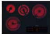
KM5840 76 cm (30 po.)