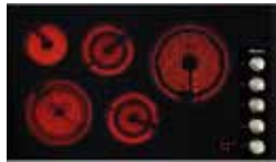
KM5627 90 cm (36 po.)