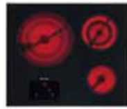
KM5820 60 cm (24 po.)