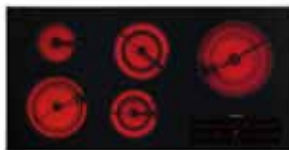
KM5880 106 cm (42 po.)