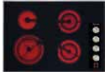
KM5624 76 cm (30 po.)