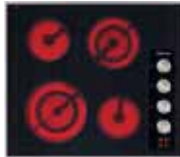
KM5621 60 cm (24 po.)