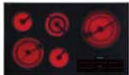
KM5860 90 cm (36 po.)